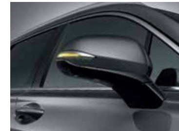
LED Outside Mirror Repeaters