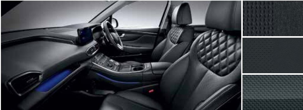
Obsidian Black One-tone Interior (Hanya tersedia untuk trim: Style & Prime)