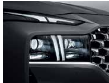
Full LED Projection Headlamp