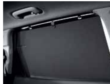
Rear Door Manual Curtain