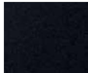
Phantom Black Pearl