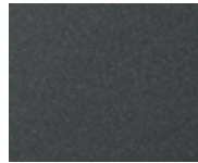
Magnetic Gray Metallic