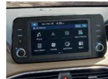
8" Touch Display