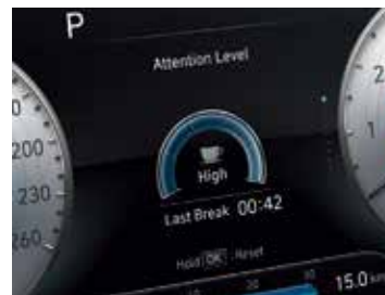
Driver Attention Warning (DAW)