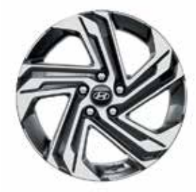
18" Alloy Wheels