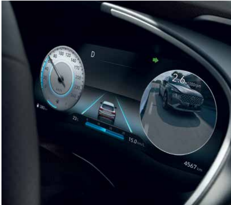
12.3" Full LCD Cluster & Blind-Spot View Monitor (BVM)