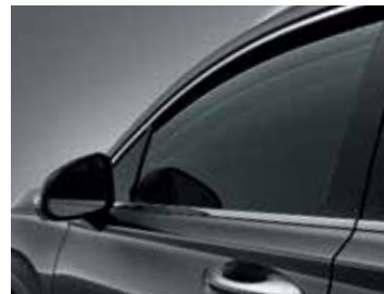
Safety Power Window