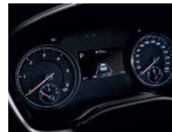
4.2" TFT LCD Cluster