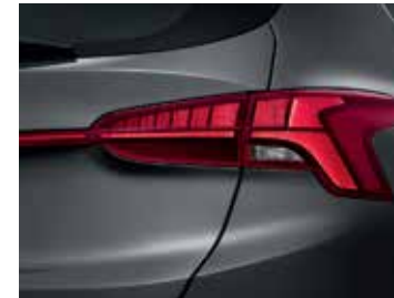
LED Rear Combination Lamps