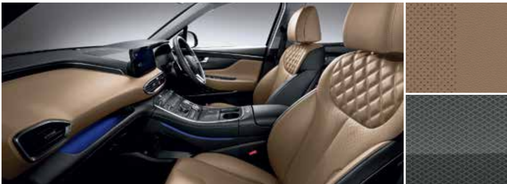
Camel Two-tone Interior (Hanya tersedia untuk trim: Signature)