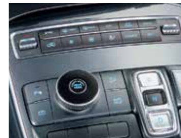
Full Auto Air Conditioning System