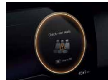
Rear Occupant Alert